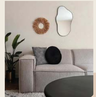
Bank Quebec @lifeby.mich