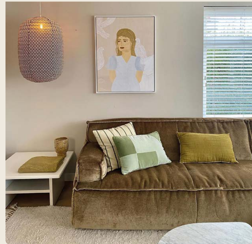
Bank Barletta @oui_atelier_