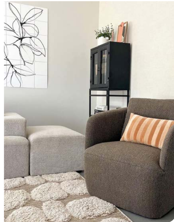
Fauteuil Loreen @melanie.willemsen