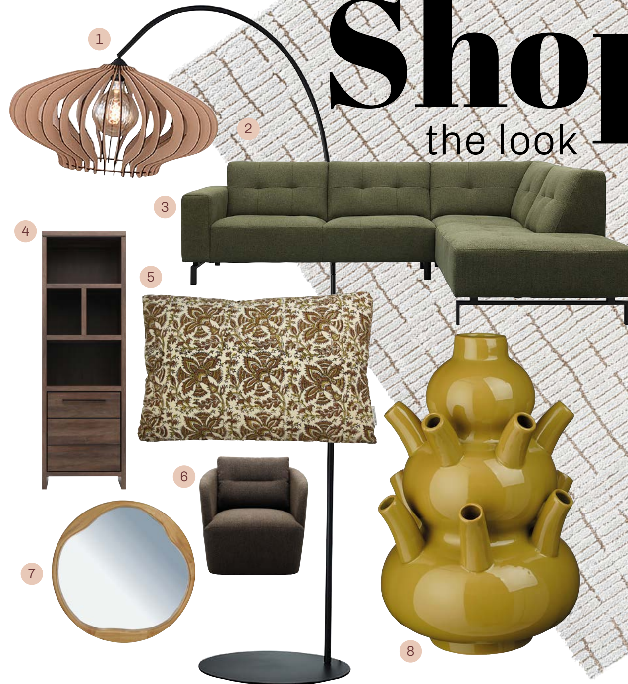
1. Vloerlamp Ulox | 2. Vloerkleed Moby | 3. Bank Viborg | 4. Boekenkast Sefro | 5. Sierkussens Katoen | 6. Fauteuil Loreen | 7. Spiegel Rubberwood | 8. Tulpvaas Marlijn Let op: de voorraad van bovenstaande producten verschilt per winkel.