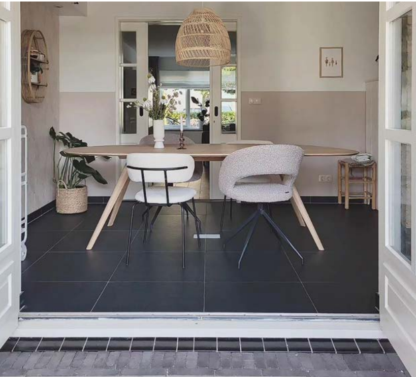
Eetkamerstoel Yuna @mandyroozeboom