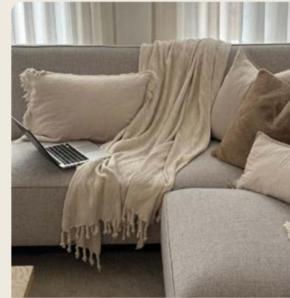
Bank Vik @homeofmirthe