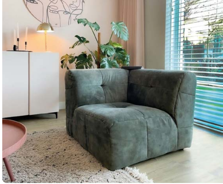
Bank Cluny @cozioaza.nl

We zien graag hoe onze items in jullie interieur staan te shinen . Heb jij jouw nieuwe meubel of accessoire een mooi plekje gegeven? Deel dan een foto of video via Instagram en gebruik #trendhopperthuis of tag @trendhopper. Doe dit vóór 1 juli 2024 om kans te maken op deze te gekke prijs! De winnaar wordt woensdag 3 juli bekend gemaakt via ons Instagram account. Stay tuned!